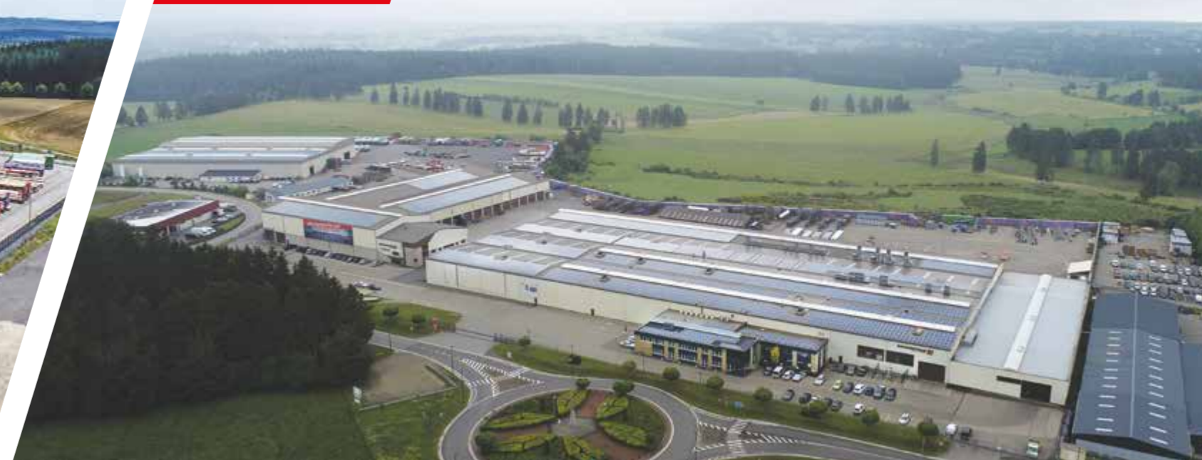
BELGIË - BÜLLINGEN