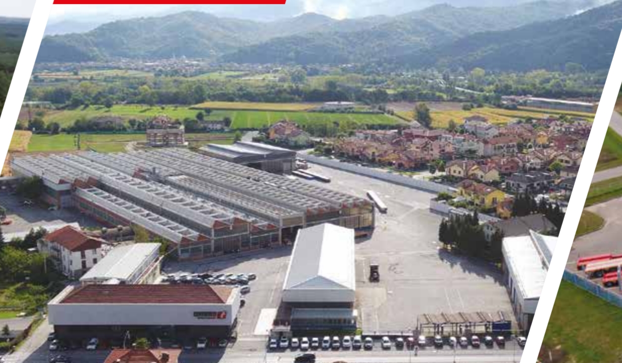
ITALIË - BORGO SAN DALMAZZO