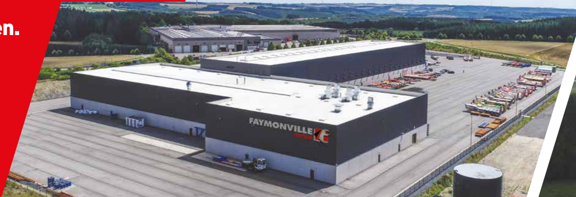
LUXEMBURG - LENTZWEILER