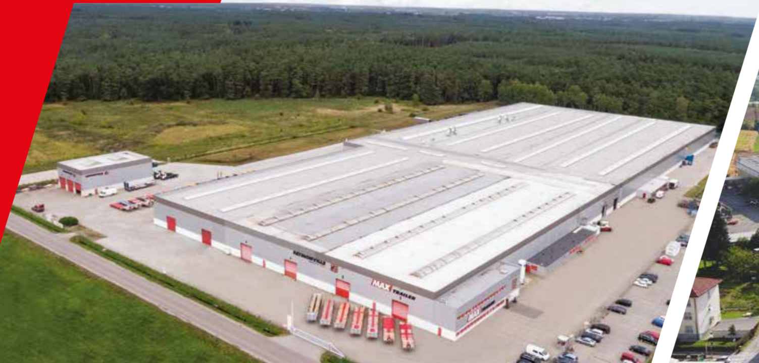
POLEN - GOLENIOW